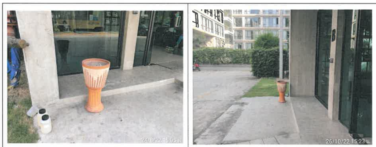
รูปที่ 2-44 แสดงพื้นที่สุขุมหรือไว้สำหรับผู้มาใช้บริการ บริเวณด้านหน้าโครงการ