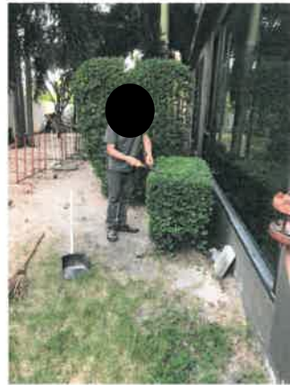
รูปที่ 2-2 แสดงเจ้าหน้าที่ดูแลพื้นที่สีเขียวภายในโครงการ