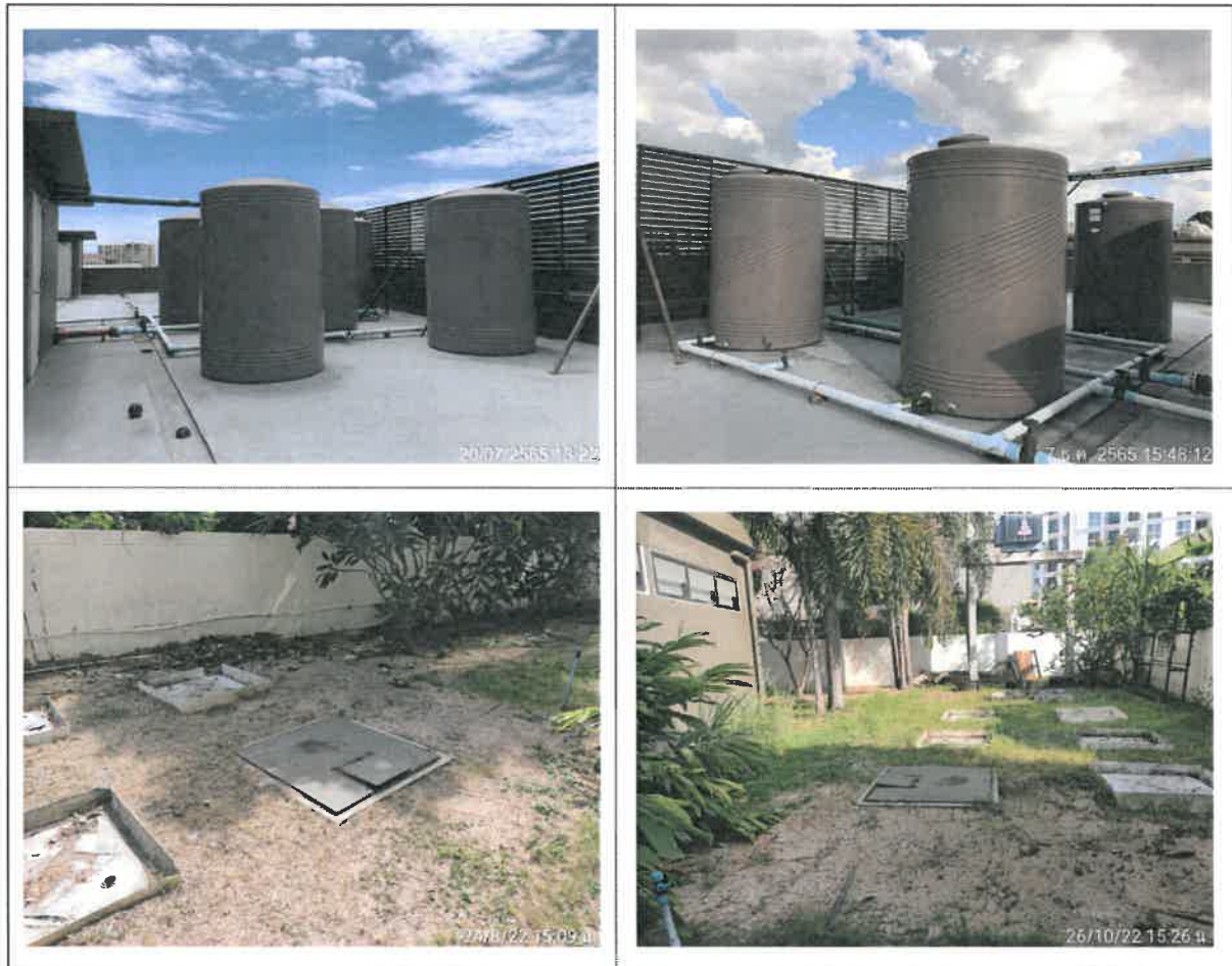
รูปที่ 2-6 แสดงถังเก็บน้ำชั้นดาดฟ้าและถังเก็บน้ำใต้ดินของโครงการ