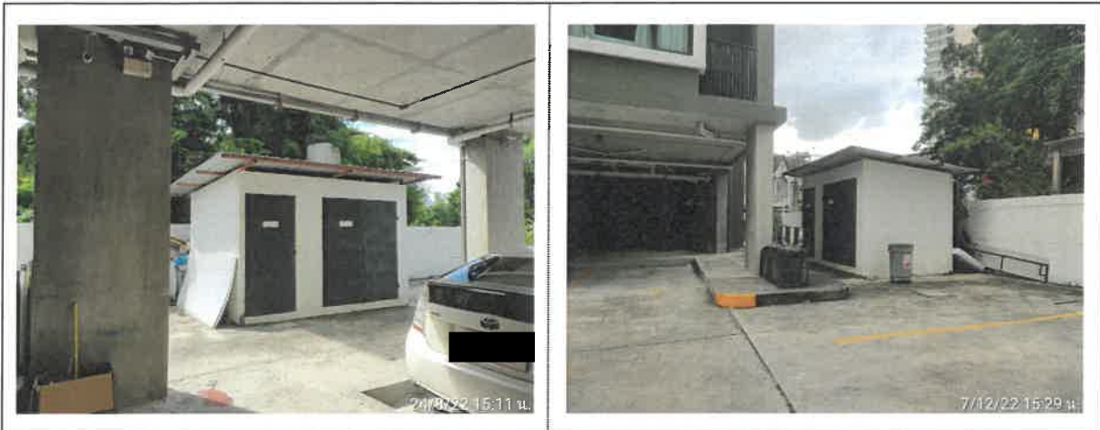
รูปที่ 2-16 แสดงห้องพักมูลฝอยภายในโครงการ