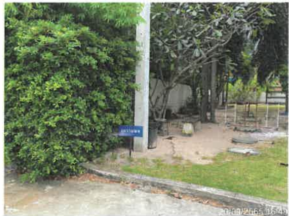
รูปที่ 2-37 แสดงจุดรวมพลไว้ภายในโครงการ