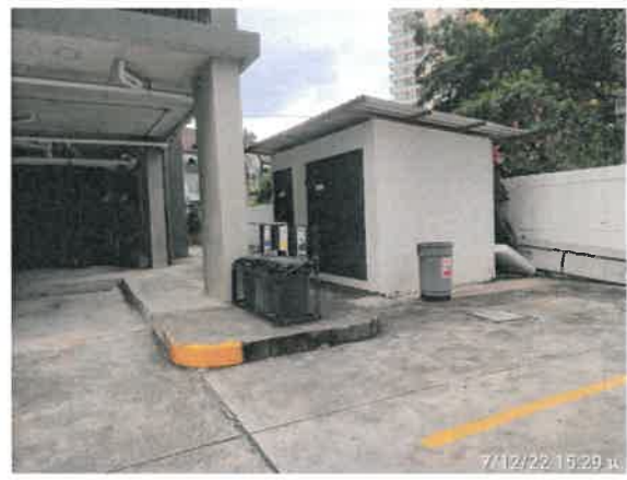
รูปที่ 2-14 แสดงถังรองรับมูลฝอยขนาด 30 ลิตร บริเวณพื้นที่จอดรถภายในโครงการ (ต่อ)