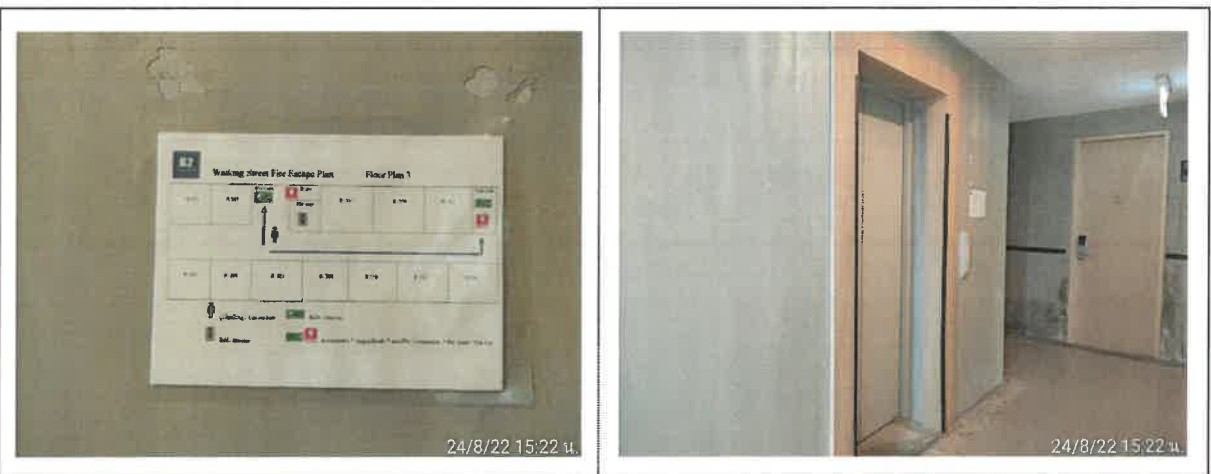
รูปที่ 2-42 แสดงป้ายแผนผังการอพยพหนีไฟไว้บริเวณด้านหน้าลิฟต์ของทุกชั้น