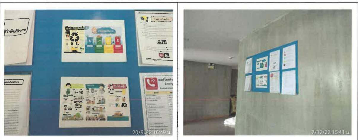
รูปที่ 2-18 แสดงป้ายคัดแยกมูลฝอยบริเวณบอร์ดประชาสัมพันธ์ภายในโครงการ