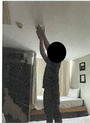
รูปที่ 2-23 แสดงเจ้าหน้าที่ทำความสะอาดหลอดไฟ และเปลี่ยนหลอดที่เสื่อมสภาพภายในโครงการ