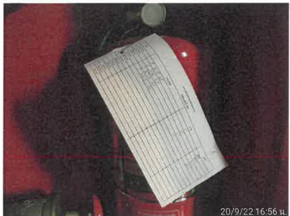
รูปที่ 2-38 แสดงการตรวจสอบอุปกรณ์ดับเพลิงภายในโครงการ