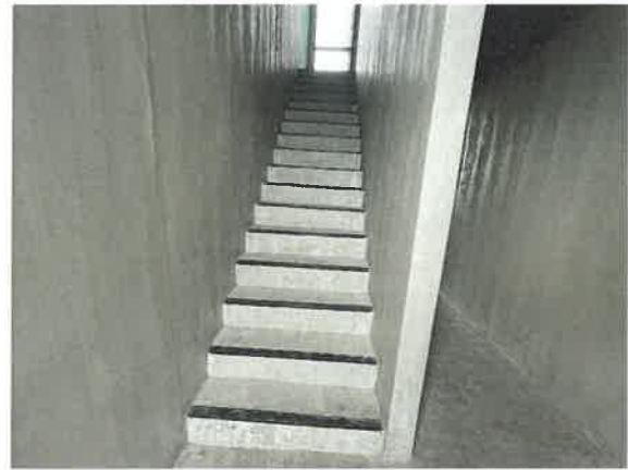
รูปที่ 2-36 แสดงบันไดหลักและบันไดหนีไฟภายในโครงการ (ต่อ)