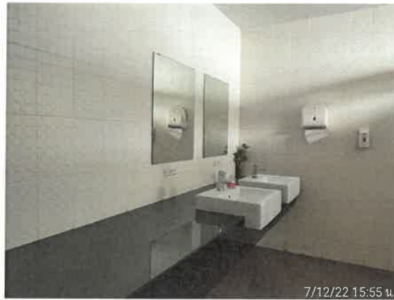
รูปที่ 2-7 แสดงป้าย “โปรดช่วยกันประหยัดน้ำ PLEASE TURN OFF THE WATER” (ต่อ)