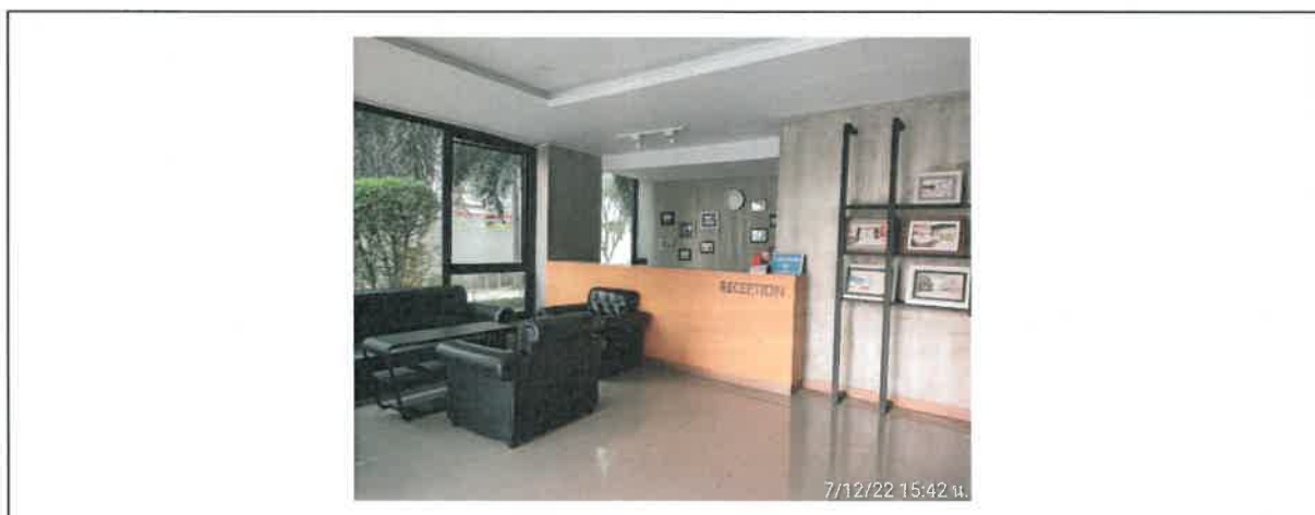
รูปที่ 2-43 แสดงเจ้าหน้าที่รับเรื่องร้องเรียนของโครงการ