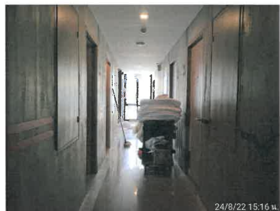
รูปที่ 2-4 แสดงแม่บ้านทำความสะอาดตามจุดต่างๆ ภายในโครงการ