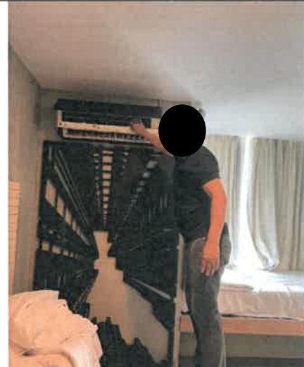
รูปที่ 2-19 แสดงเจ้าหน้าที่ตรวจสอบและทำความสะอาดเครื่องปรับอากาศภายในโครงการ