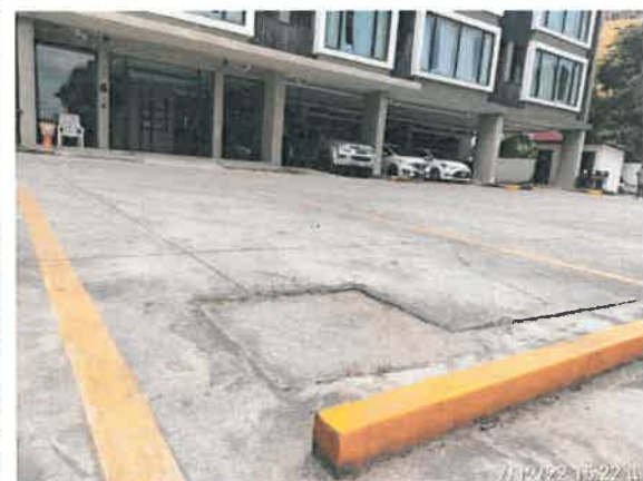
รูปที่ 2-12 แสดงบ่อหน่วงน้ำ บริเวณพื้นที่จอดรถหน้าโครงการ