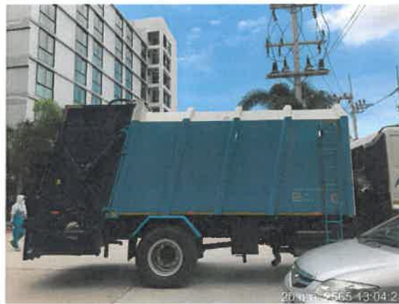
รูปที่ 2-17 แสดงรถเข้ามาเก็บขนมูลฝอยภายในโครงการ