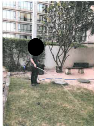
รูปที่ 2-11 แสดงฉีดพ่นน้ำบ่อดินภายในโครงการ