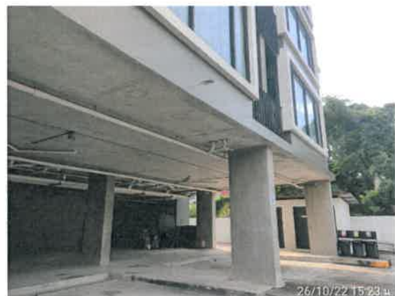
รูปที่ 2-20 แสดงไฟส่องสว่างภายในโครงการ