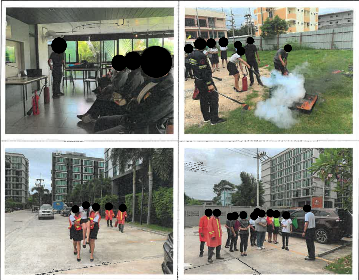
รูปที่ 2-41 แสดงการอบรมและซักซ้อมแผนการอพยพหนีไฟภายในโครงการ