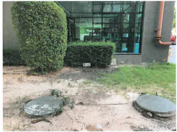
รูปที่ 2-10 แสดงป้าย “ระบบกรองชีวภาพ” บริเวณระบบบำบัดน้ำเสียของโครงการ