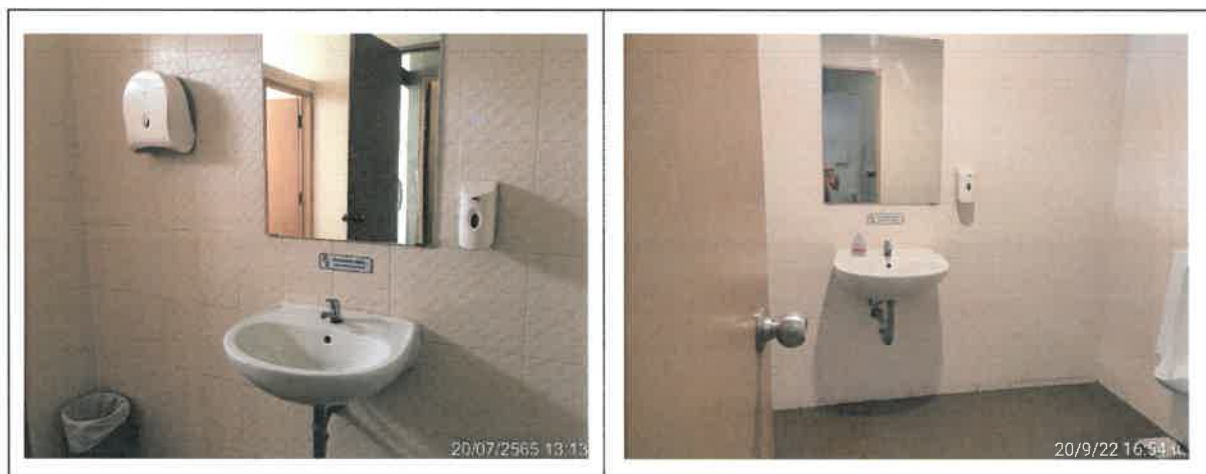
รูปที่ 2-7 แสดงป้าย “โปรดช่วยกันประหยัดน้ำ PLEASE TURN OFF THE WATER”