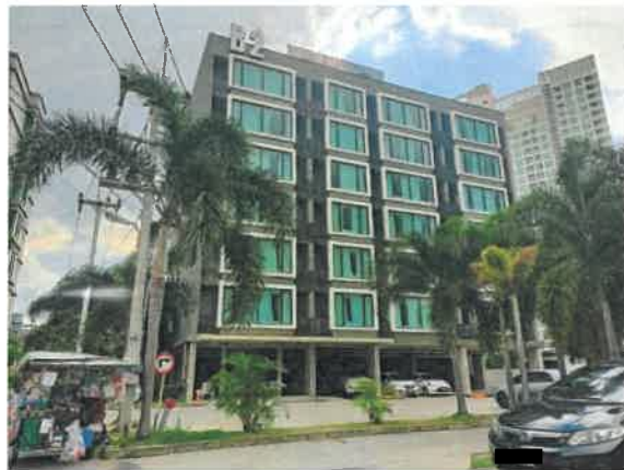
รูปที่ 2-30 แสดงตัวอาคารของโครงการ