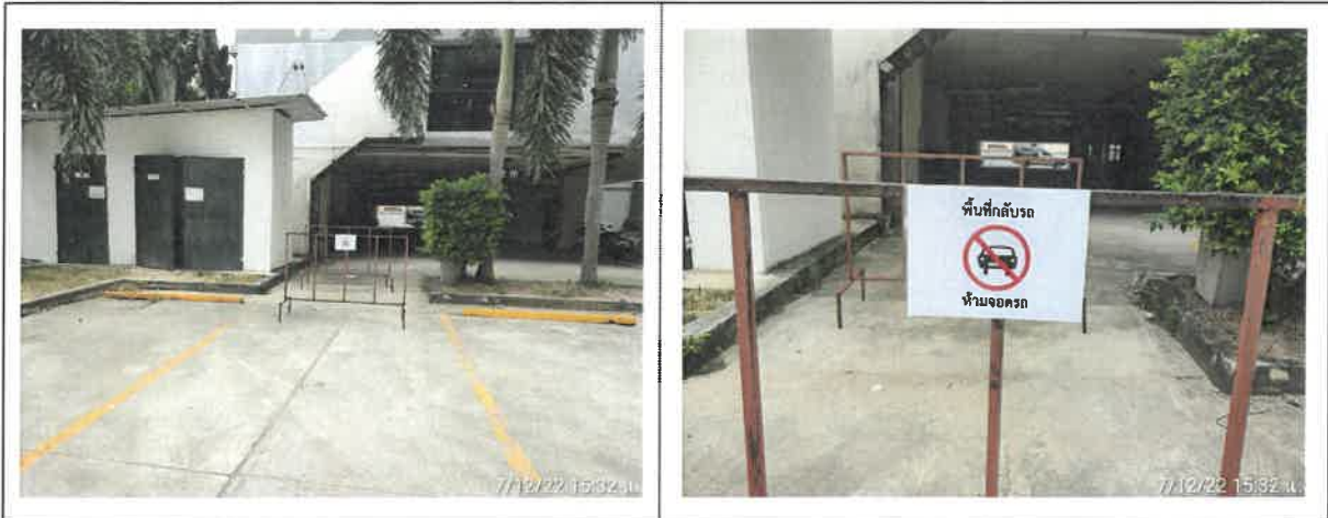
รูปที่ 2-29 แสดงพื้นที่กักบริเวณและป้ายห้ามจอดบริเวณพื้นที่กักบริเวณภายในโครงการ (ต่อ)