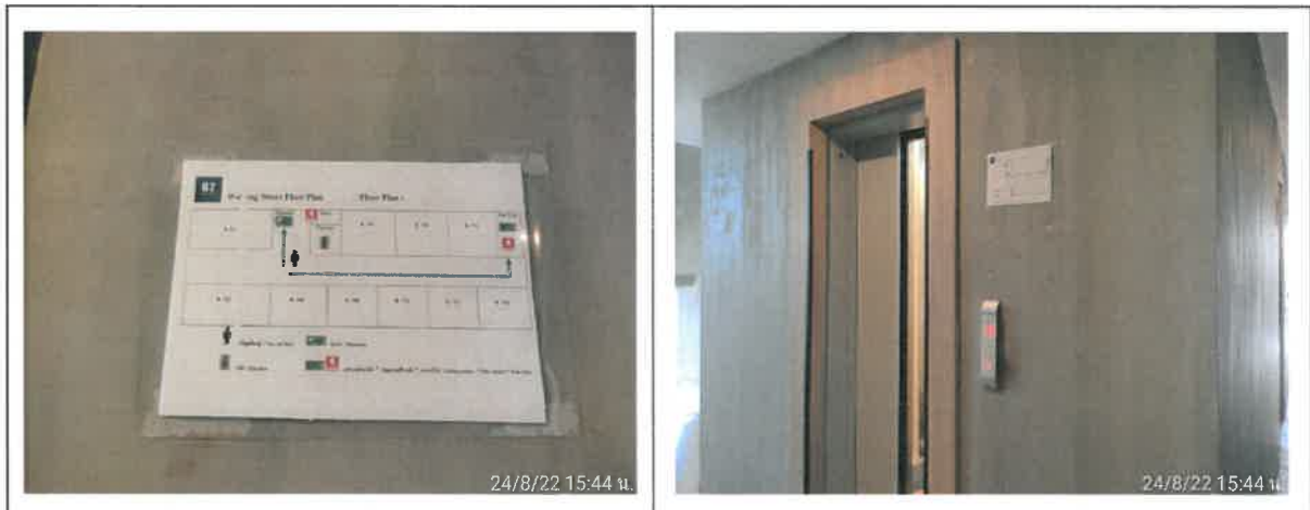
รูปที่ 2-42 แสดงป้ายแผนผังการอพยพหนีไฟไว้บริเวณด้านหน้าลิฟต์ของทุกชั้น (ต่อ)