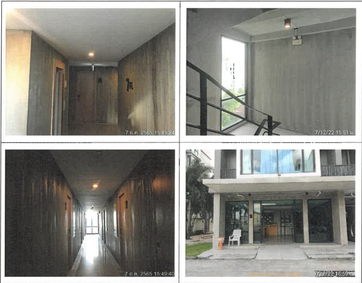
รูปที่ 2-20 แสดงไฟส่องสว่างภายในโครงการ (ต่อ)