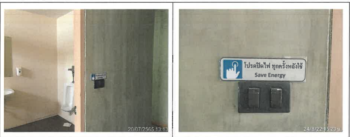
รูปที่ 2-21 แสดงป้ายข้อความ “โปรดปิดไฟ ทุกครั้งหลังใช้” บริเวณสวิตช์ไฟห้องน้ำส่วนกลาง และบริเวณทางเดินภายในอาคาร