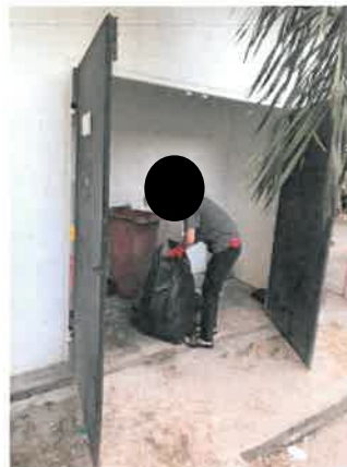
รูปที่ 2-15 แสดงแม่บ้านรวบรวมมูลฝอย ตรวจสอบถังรองรับมูลฝอยและล้างถังรองรับมูลฝอย ภายในโครงการ