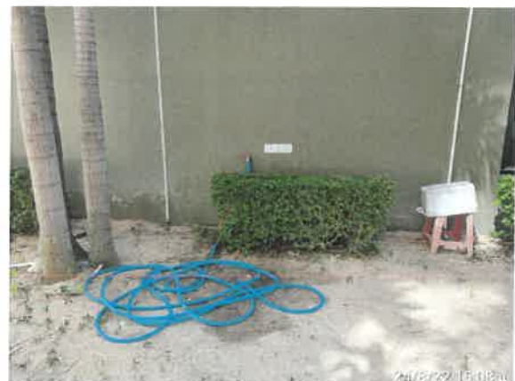
รูปที่ 2-9 แสดงการเก็บม้วนสายยาง หลังการรดน้ำต้นไม้ บริเวณพื้นที่สีเขียวภายในโครงการ