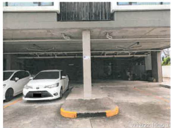
รูปที่ 2-3 แสดงป้ายข้อความ “จอดรถกรุณา ดับเครื่องยนต์ Turn Off Your Engine และห้ามเร่งเครื่องยนต์” ไว้บริเวณพื้นที่จอดรถ